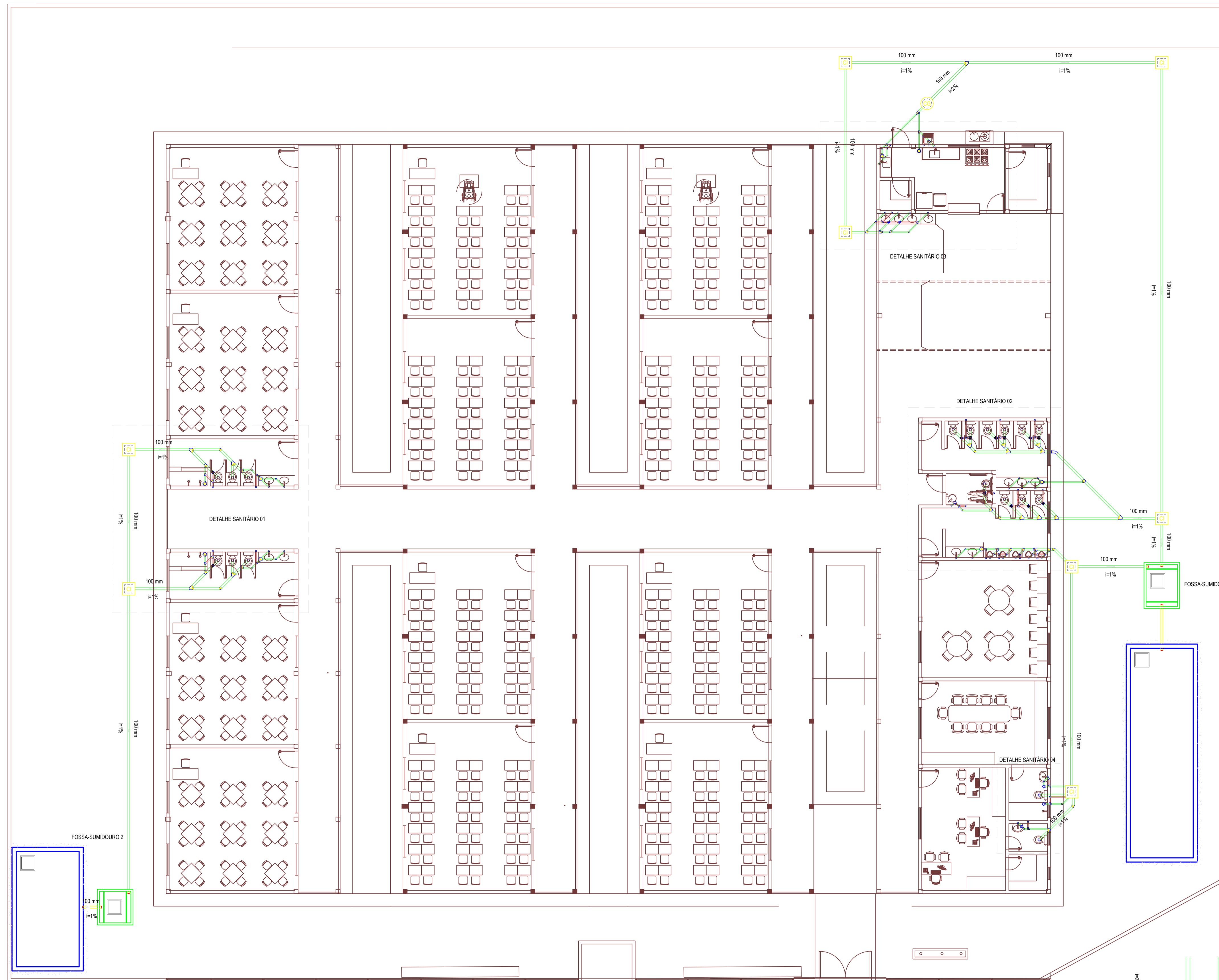
TÉRREO - INSTALAÇÕES SANITÁRIAS ESCALA: 1/100