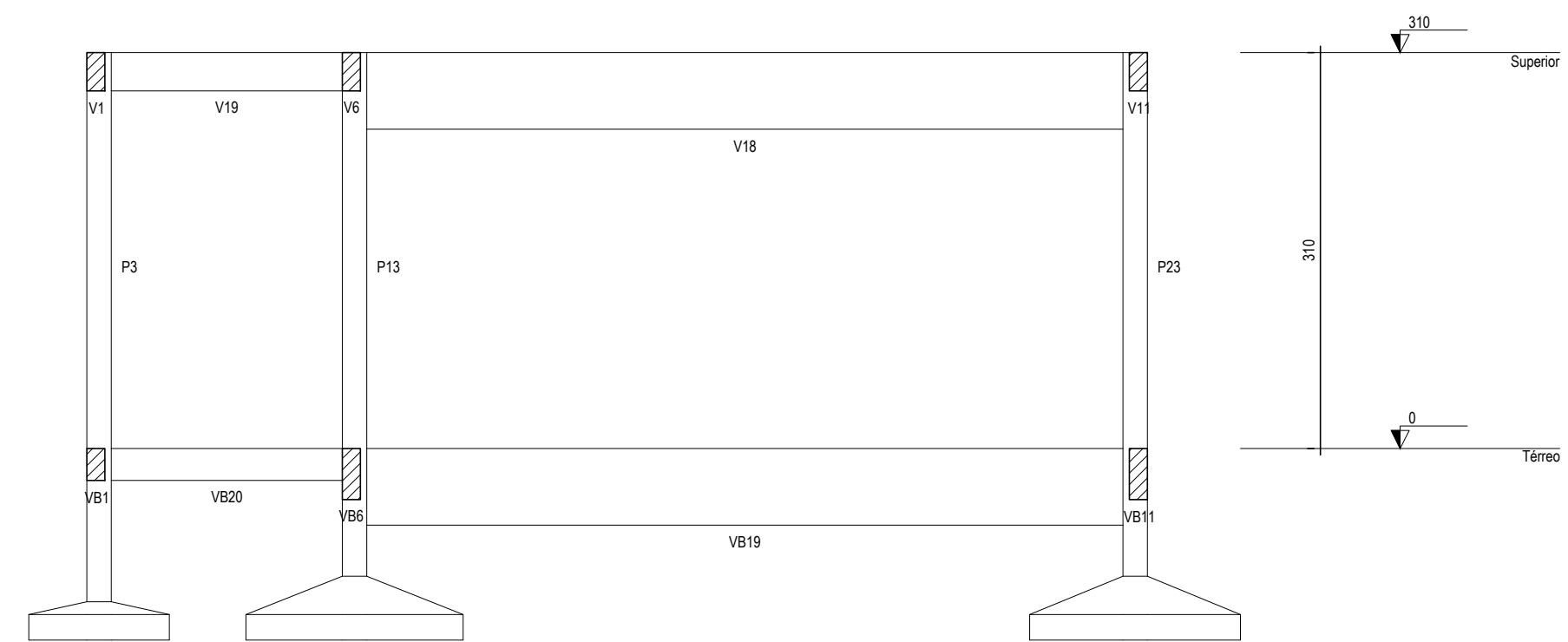
CORTE B-B ESC: 1:50