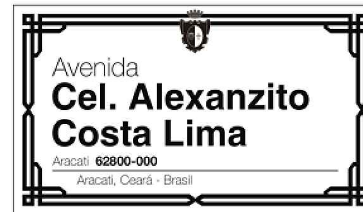
DETALHE DAS PLACAS SEM ESCALA