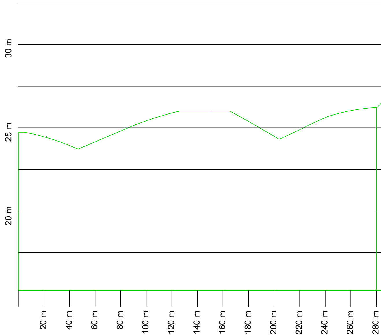
PERFIL LONGITUDINAL - SEÇÃO 01