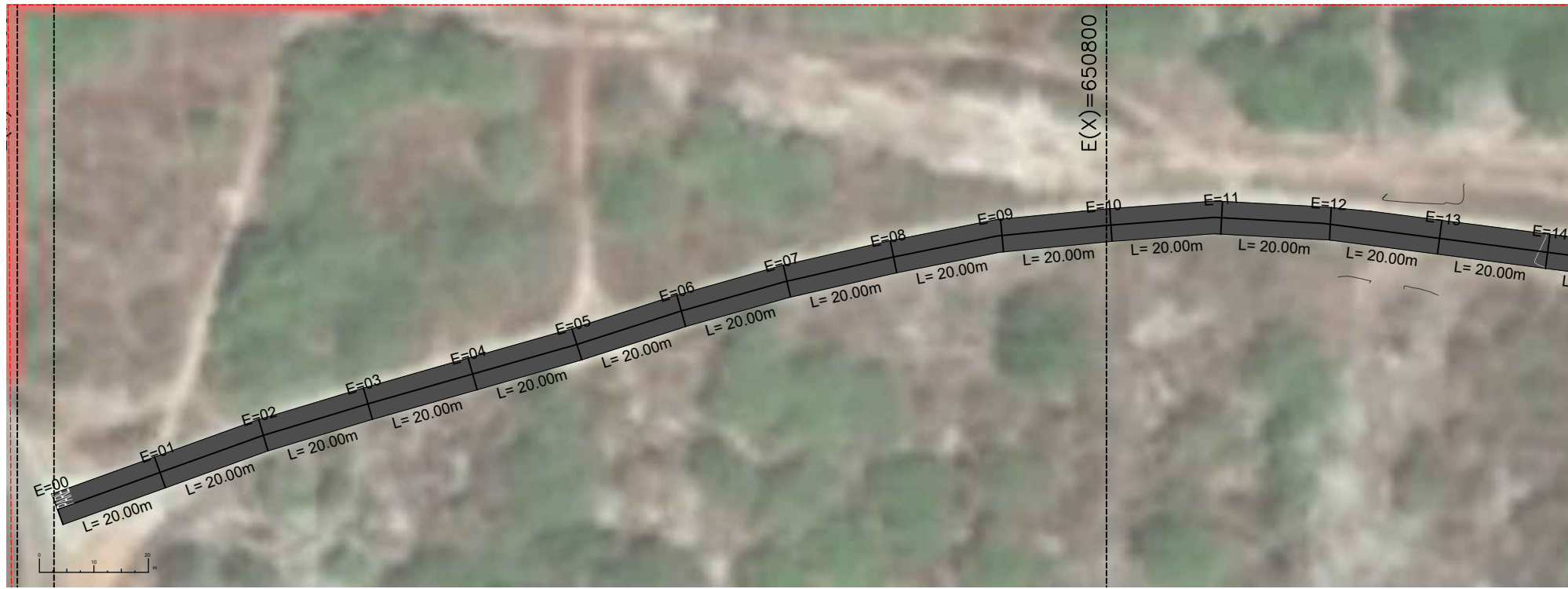
PLANTA BAIXA - SEÇÃO 01 ESCALA: 1/750