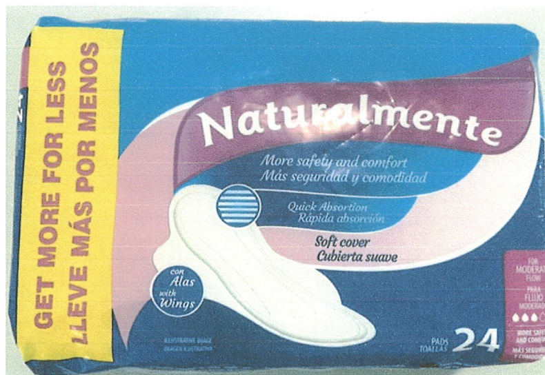
Item 01: verso.