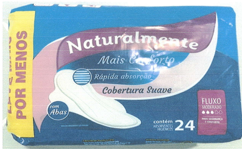
Item 01: frente.