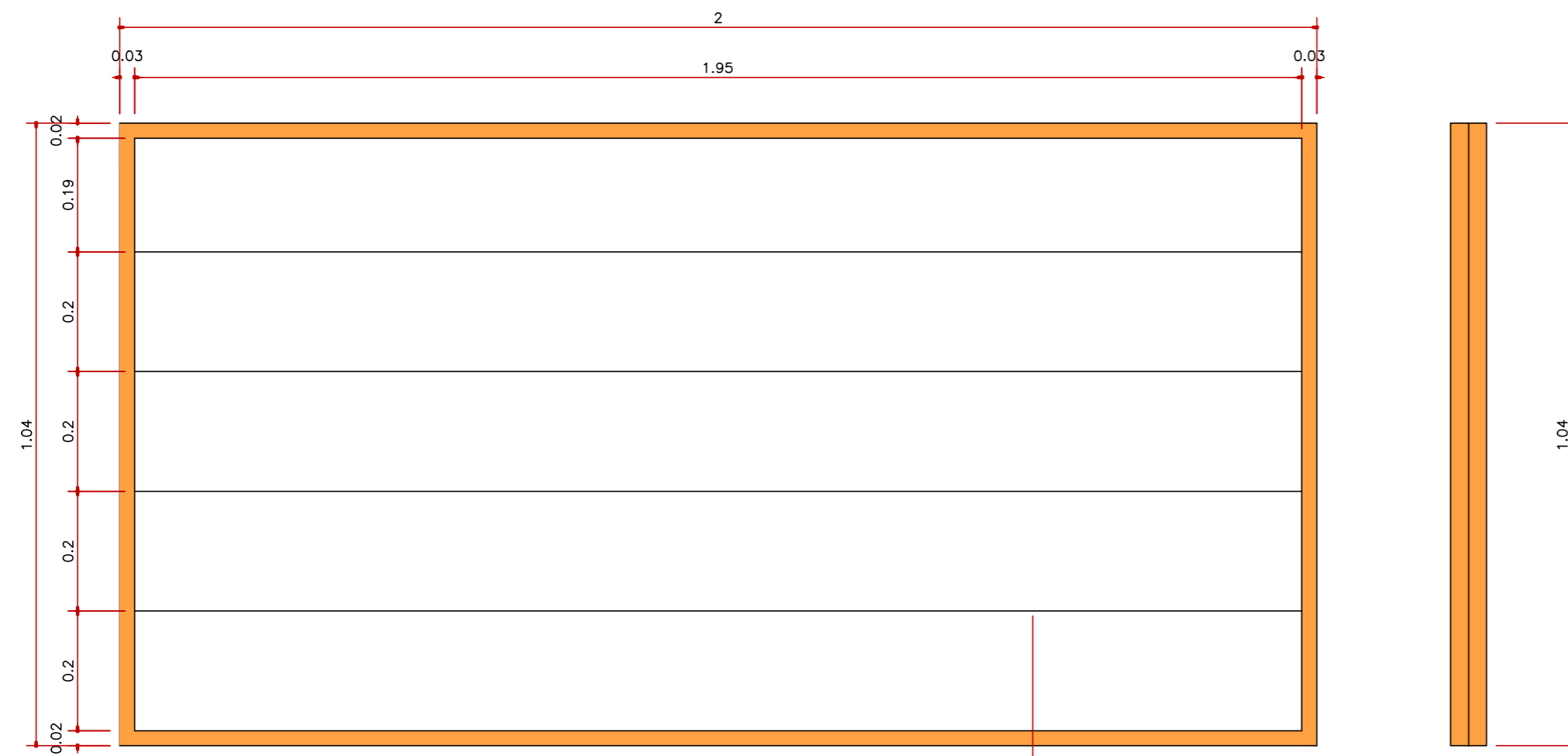
01 DETALHES VARAL COMUNITÁRIO ESCALA 1/15