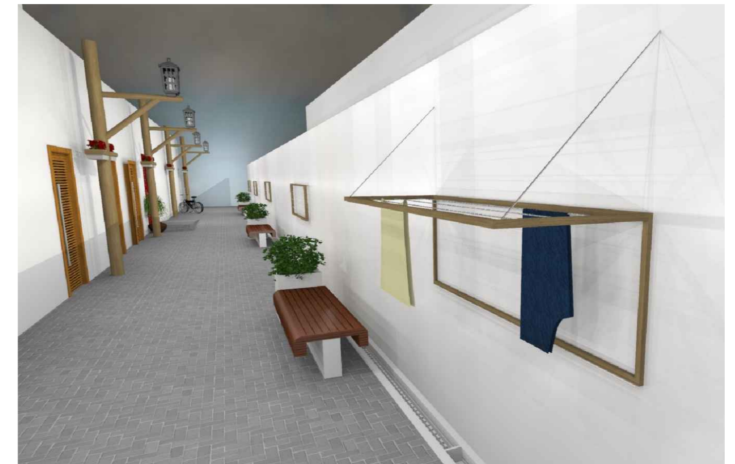
02 IMAGEM ILUSTRATIVA VARAL ABERTO ESCALA SEM