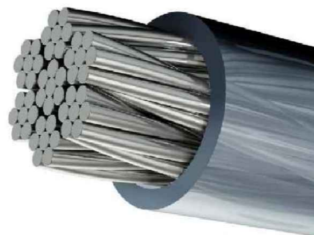
CABO DE AÇO REVESTIDO COM PROTEÇÃO PLÁSTICA OU PVC