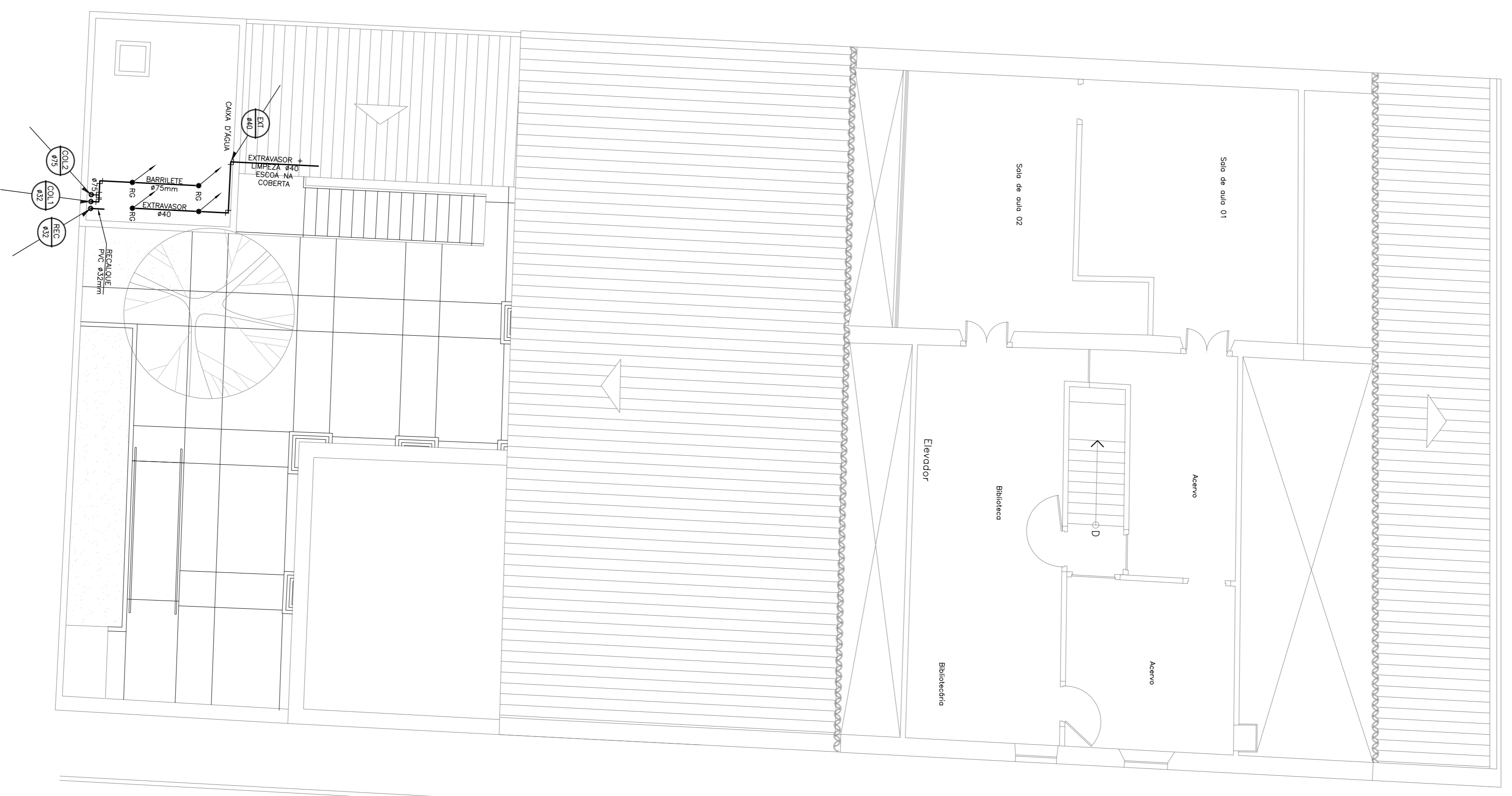
PLANTA BAIXA 2º PAVIMENTO ESCALA 1:75