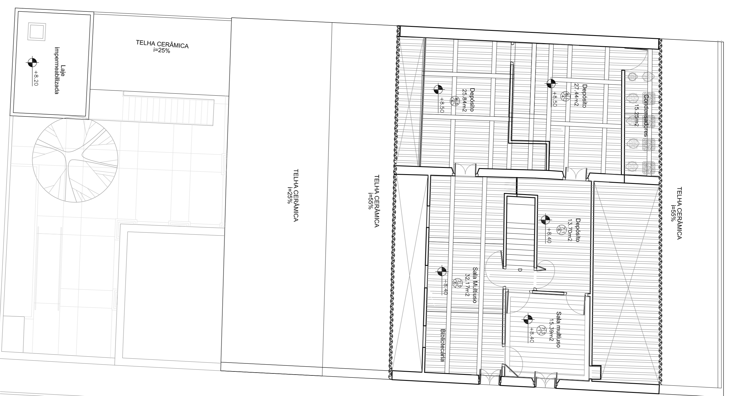
Planta 2º Pavimento esc.: 1/100 Área constr.: 168,53m²