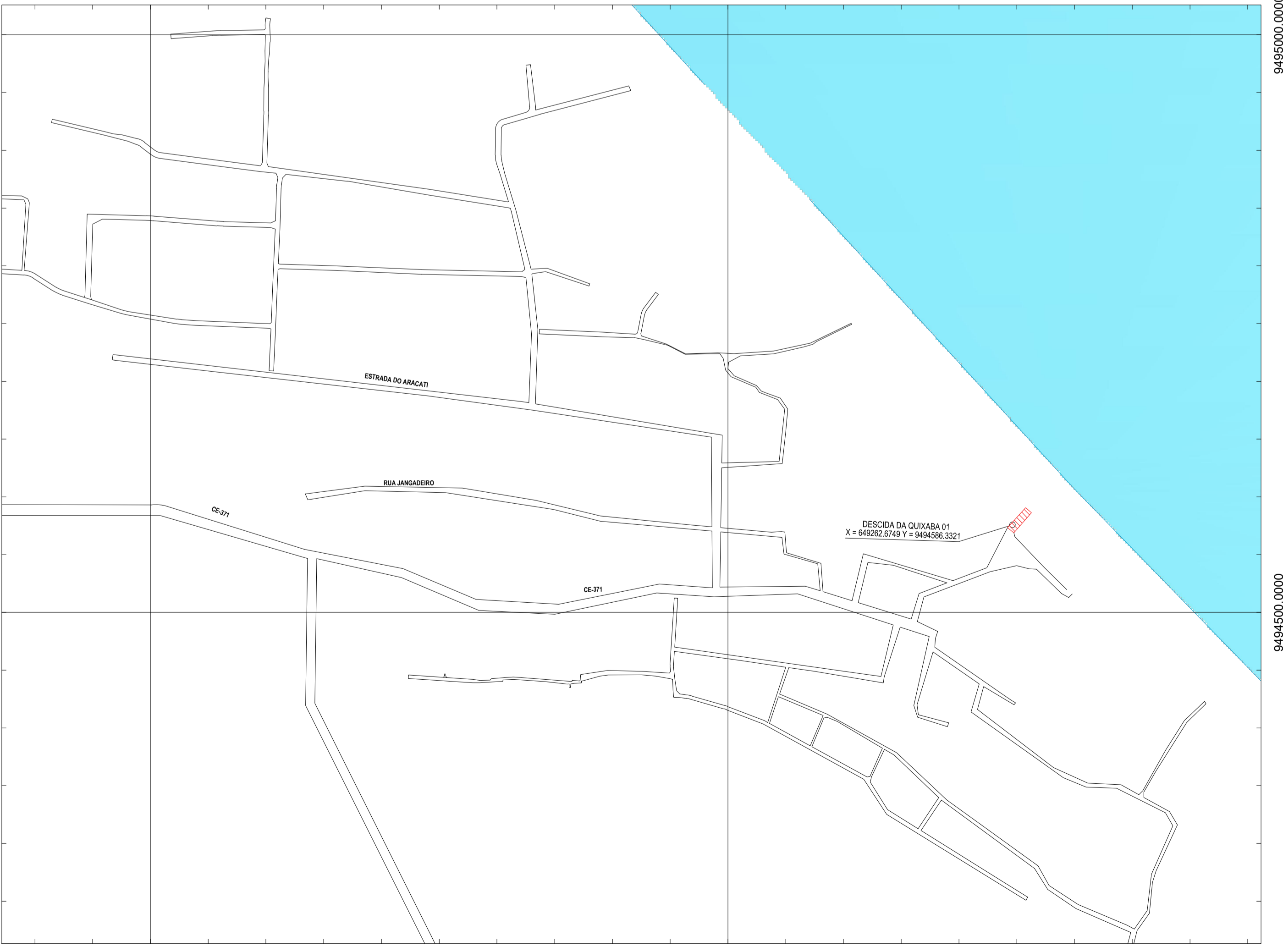
02 PLANTA DE LOCALIZAÇÃO - AMPLIAÇÃO ESCALA: 1:10.000