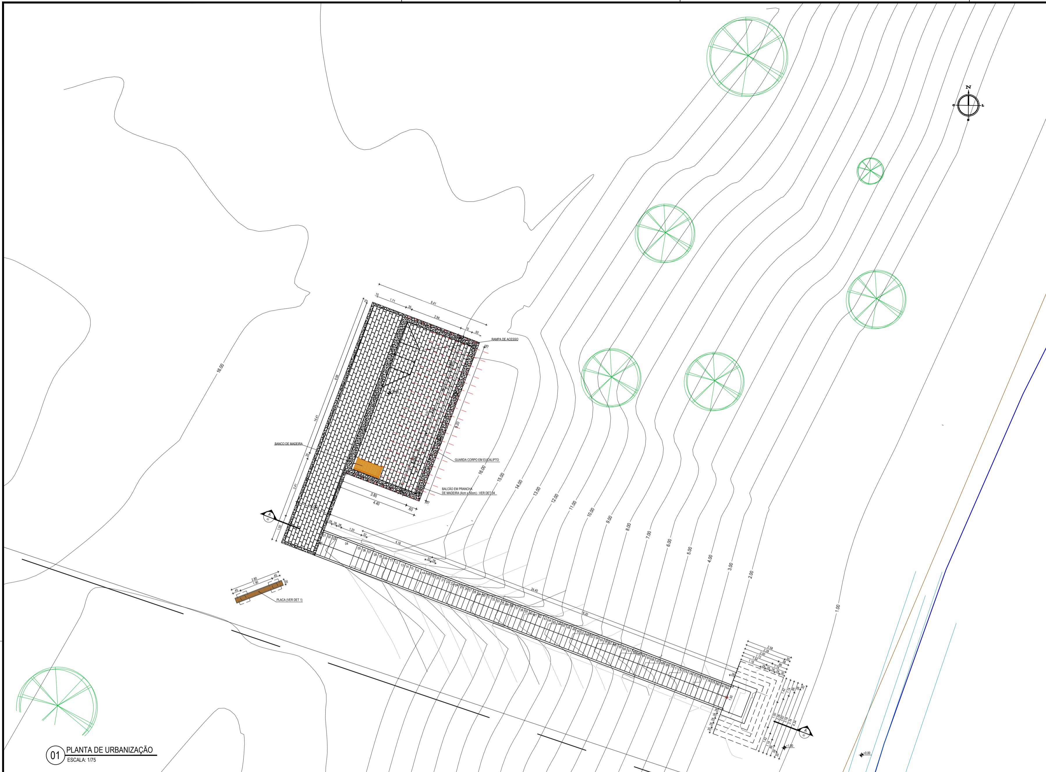
01 PLANTA DE URBANIZAÇÃO ESCALA: 1/75