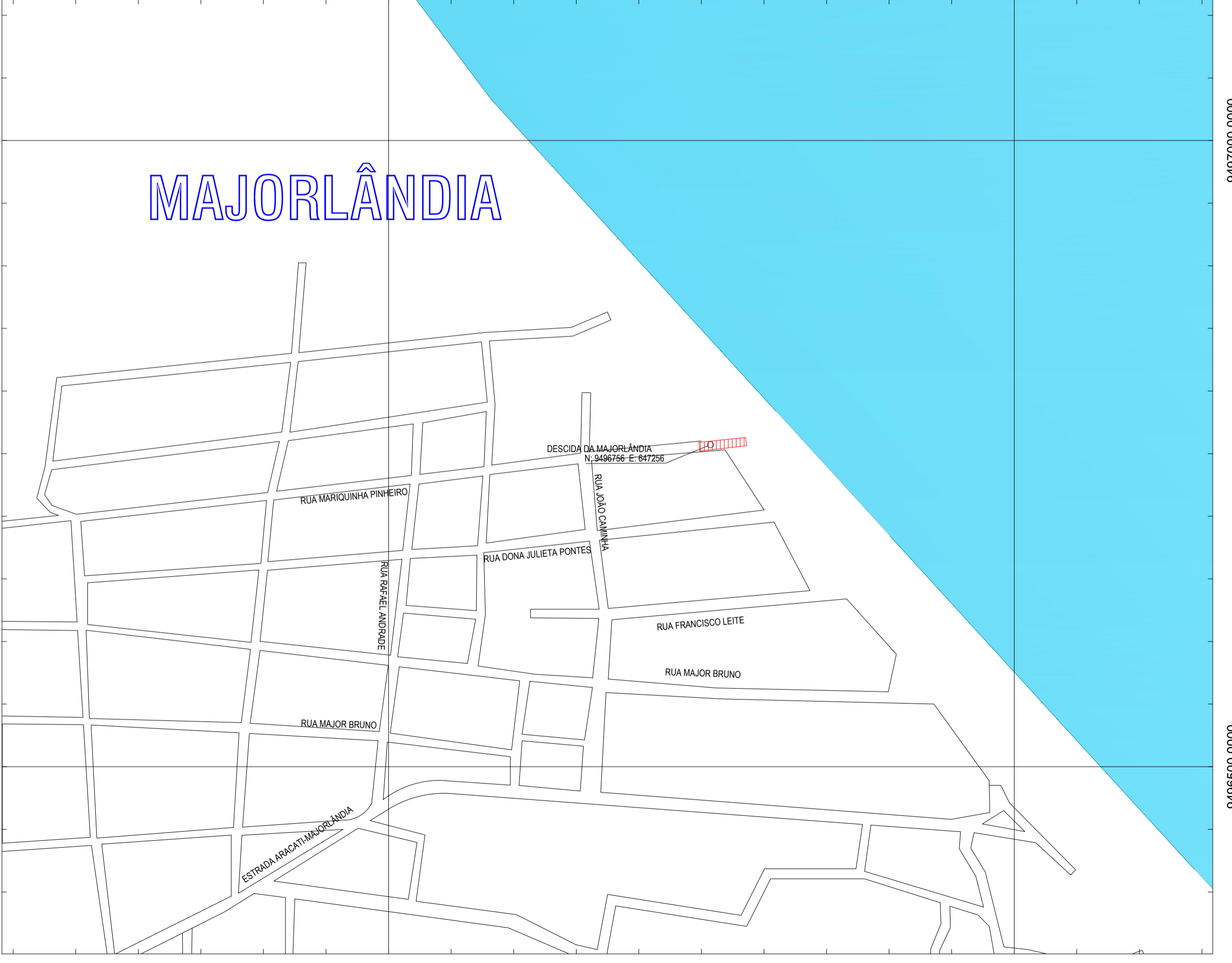
02 PLANTA DE LOCALIZAÇÃO - AMPLIAÇÃO ESCALA: 1:3.000