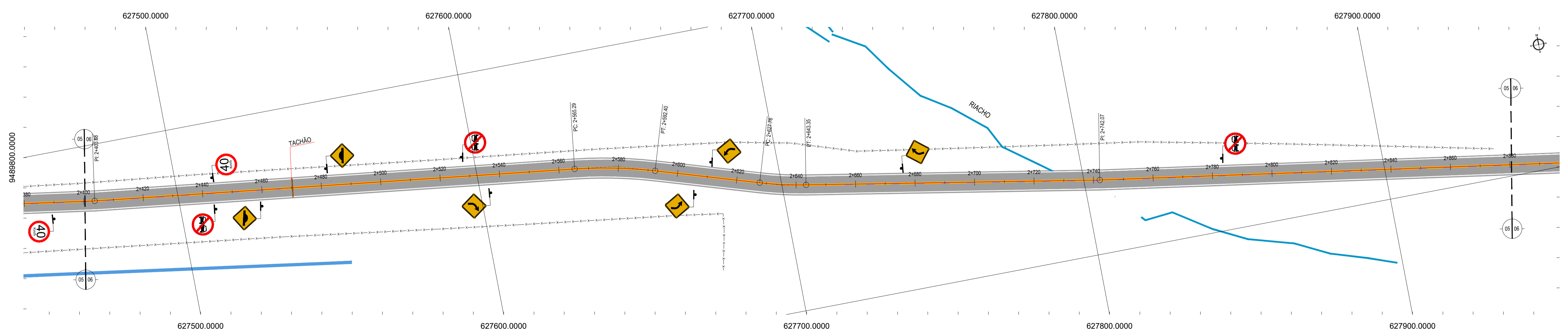
06 PLANTA BAIXA 06 1/750