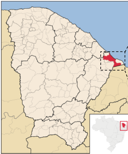
Localização do Município