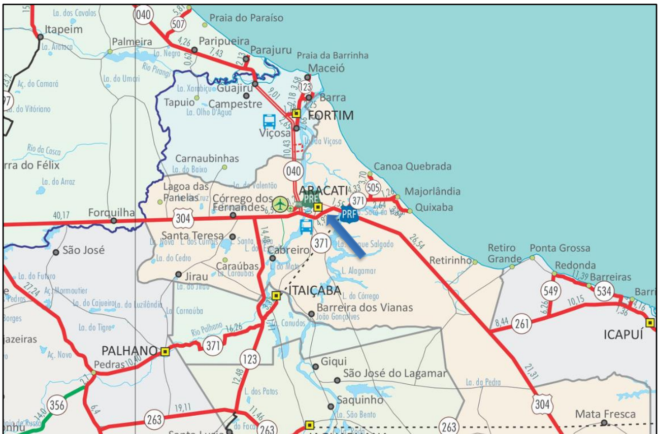
Acessos ao Município