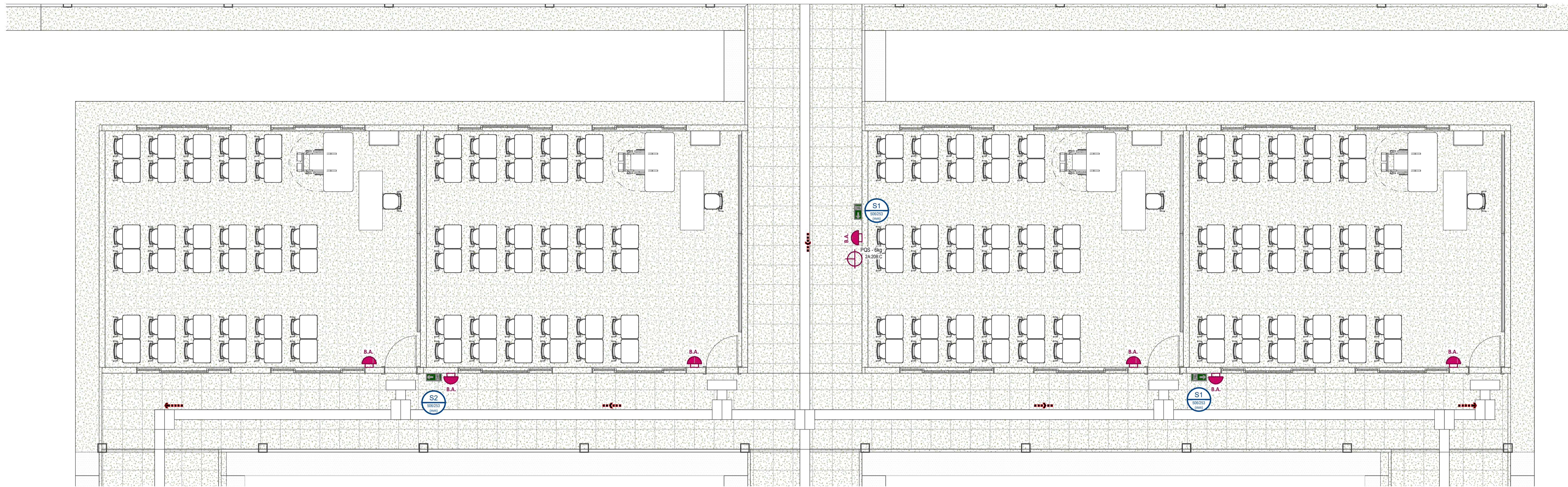
BLOCO 2 1:50