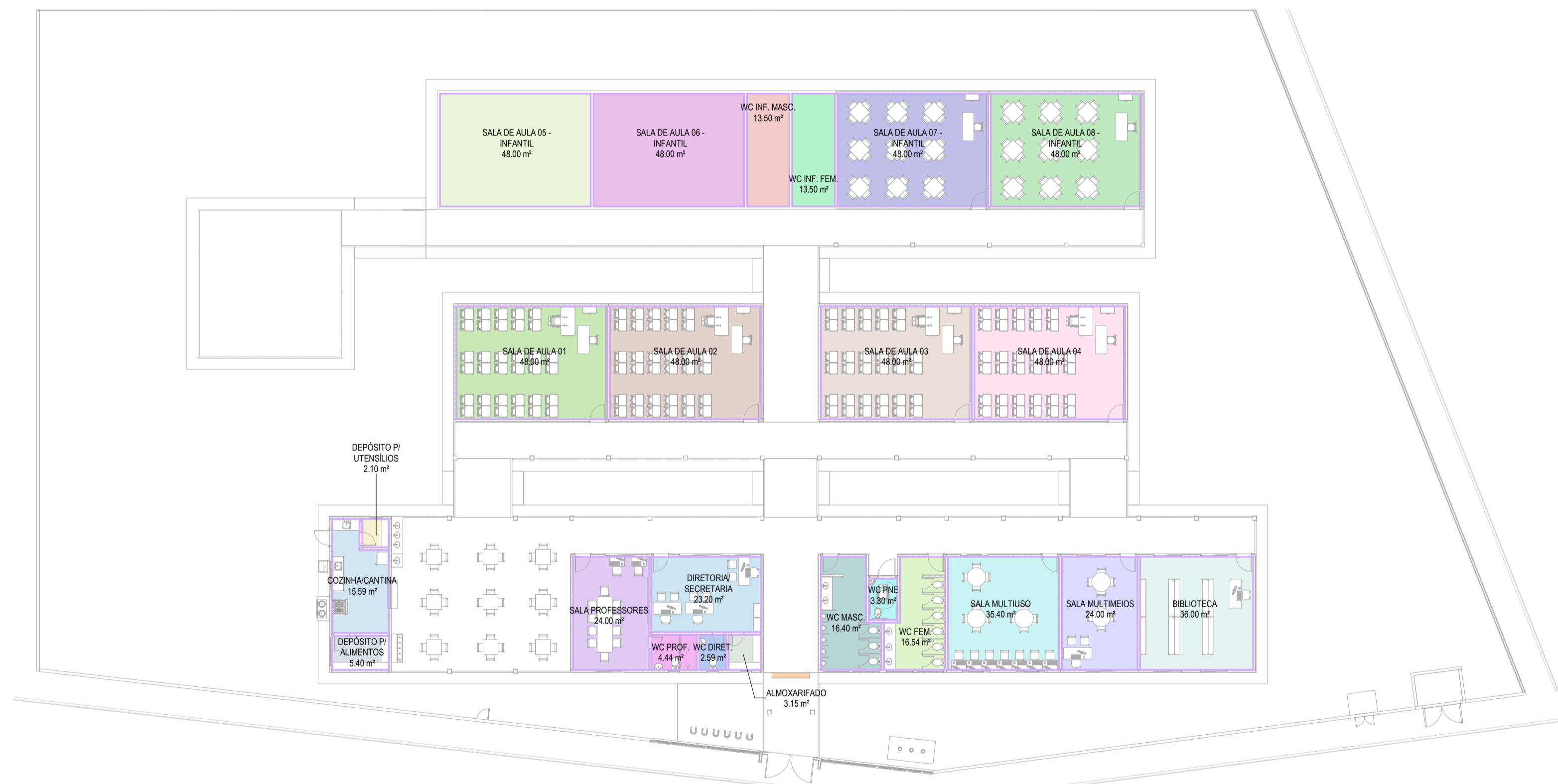
LEGENDA - ÁREA ÚTIL