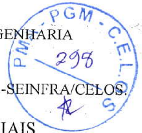
TABELA DE COMPOSIÇÃO DOS ENCARGOS SOCIAIS

REF. TOMADA DE PREÇOS Nº 31/2022-SEINFRA/CELOS.