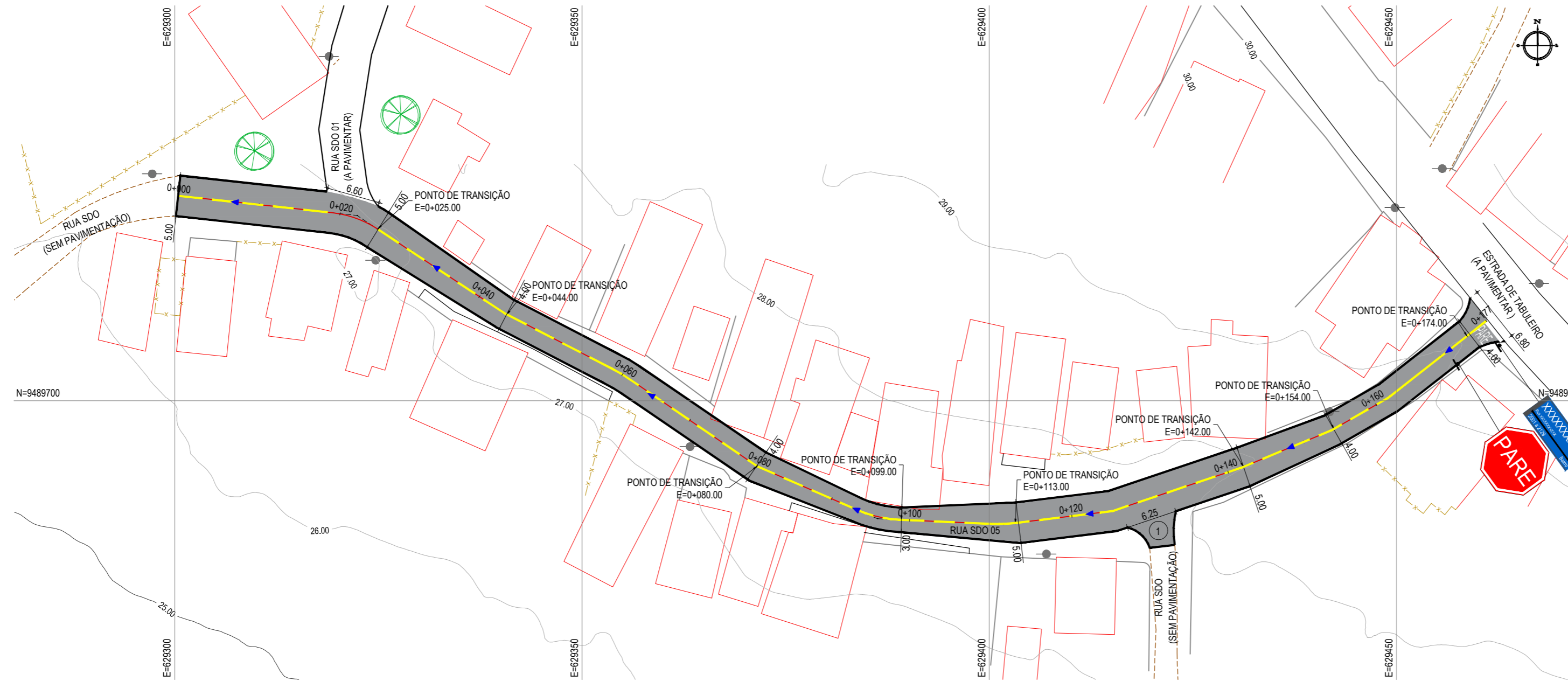
PLANTA BAIXA ESCALA: 1/500