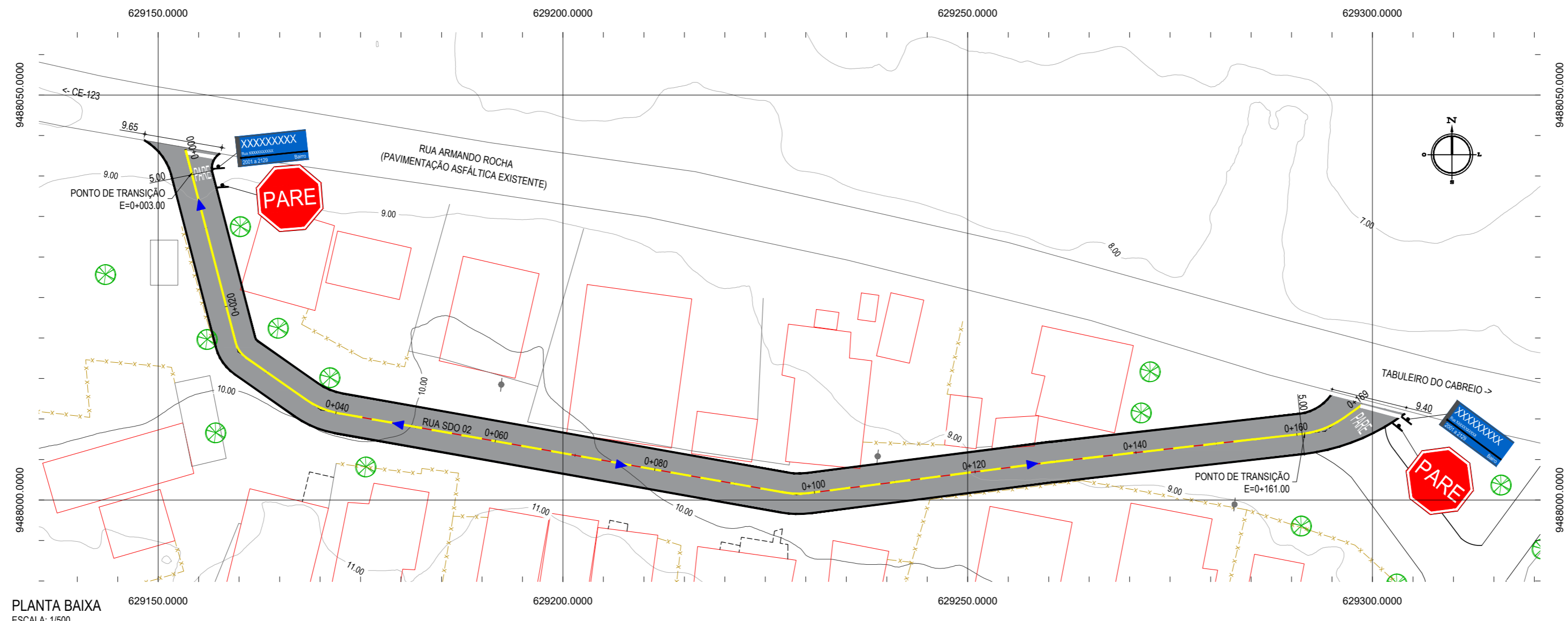
PLANTA BAIXA ESCALA: 1/500