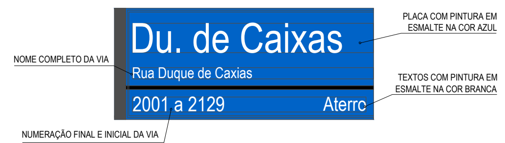
PLACA DE DENOMINAÇÃO DE VIA (DEMAIS VIAS) ESCALA: 1/10

NOTAS: EM REGRA GERAL, ESSAS COLUNAS SÃO FIXADAS EM ESQUINAS, E AS PLACAS SÃO POSICIONADAS DE FORMA A MANTEREM UM ÂNGULO DE 90° ENTRE SI, INFORMANDO OS NOMES DE LOGRADOUROS DAS VIAS QUE SE CRUZAM. QUANDO AS VIAS NÃO FOREM PERPENDICULARES, O ÂNGULO FORMADO ENTRE AS PLACAS DEVERÁ SER O MESMO ÂNGULO ENTRE OS EIXOS DAS VIAS.