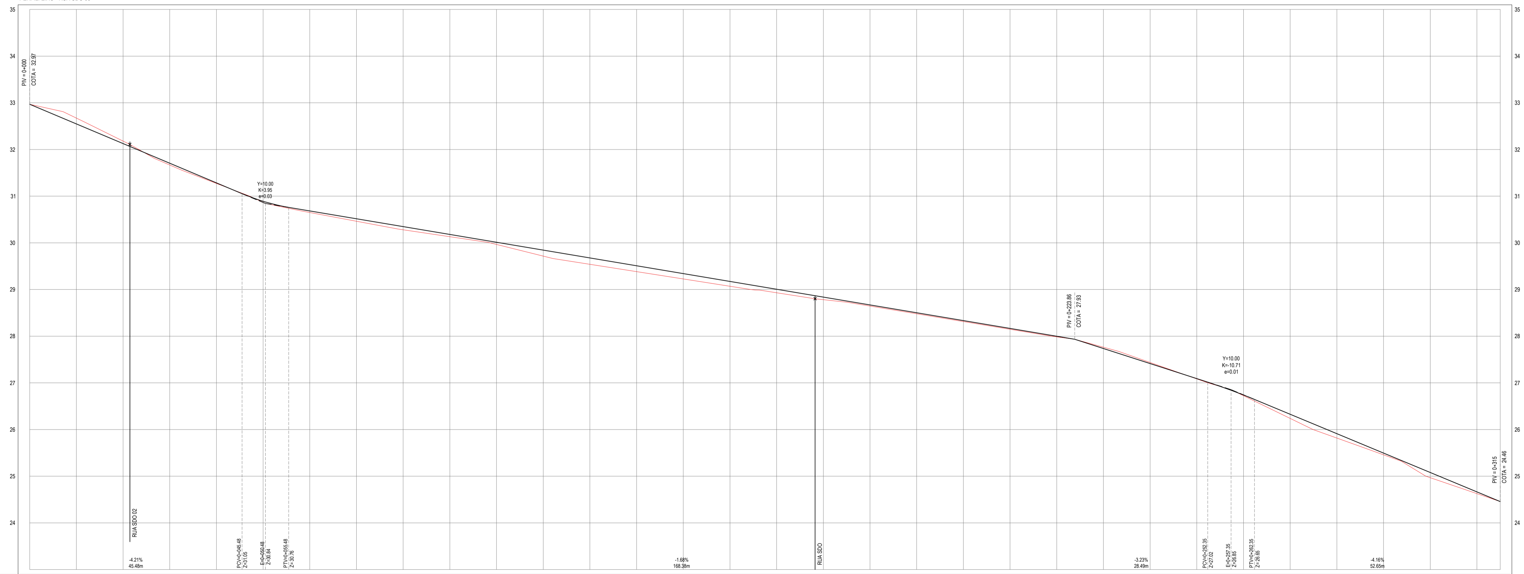
PERFIL: EIXO - RUA SDO 03