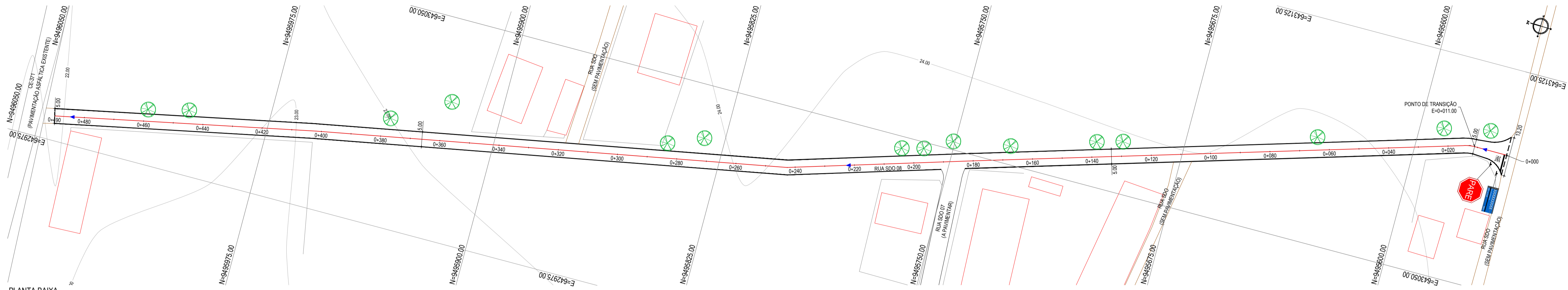
PLANTA BAIXA ESCALA: 1/750