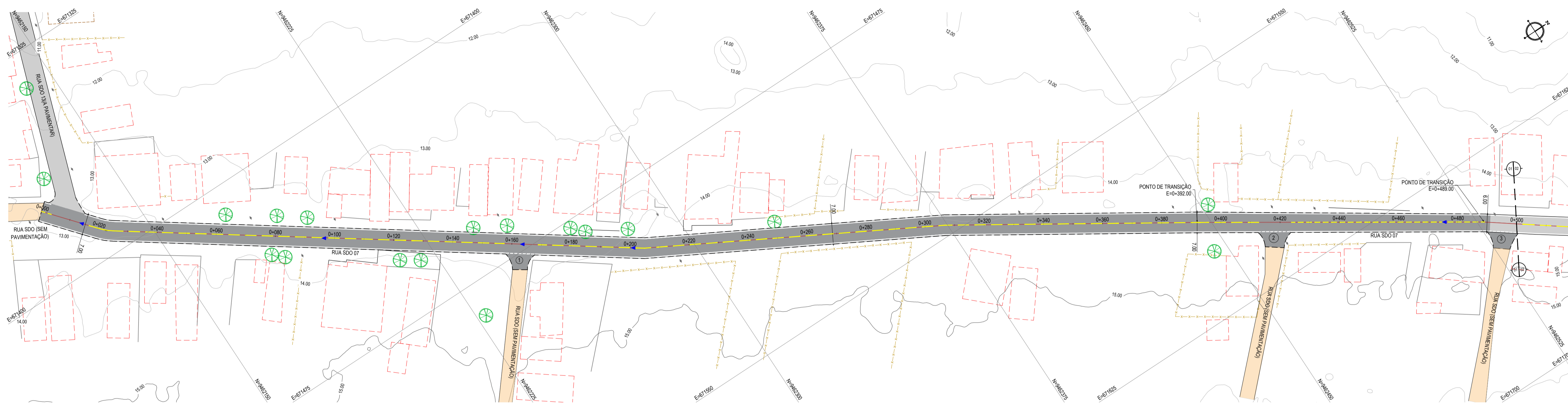
PLANTA BAIXA ESCALA: 1/750