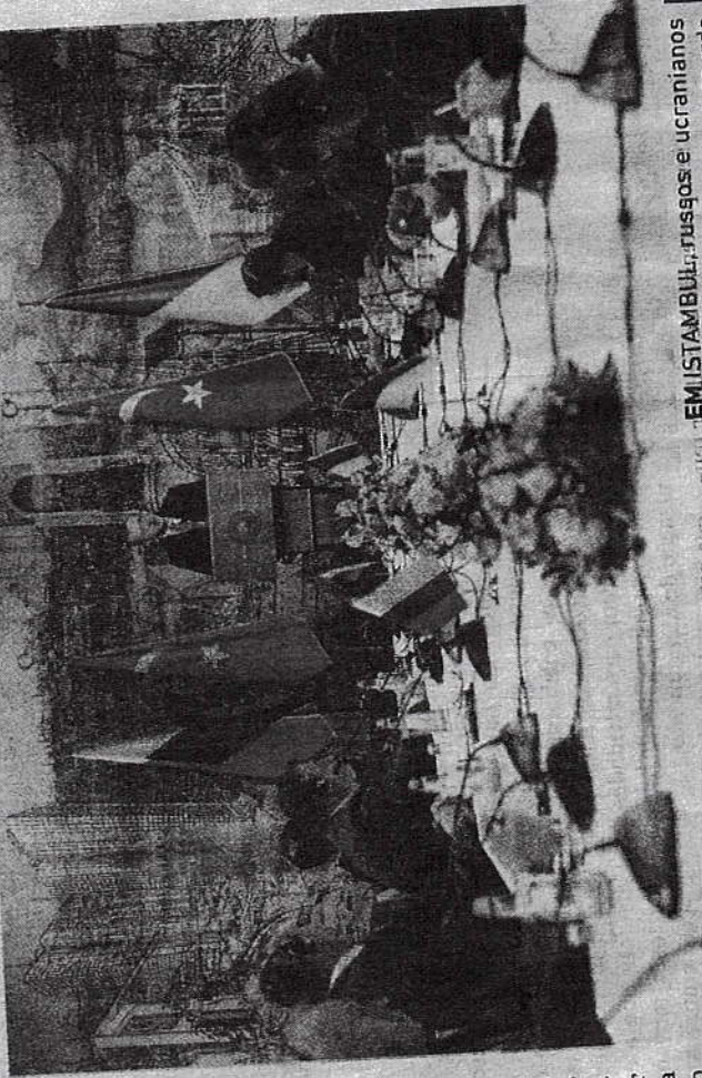
EM ISTAMBUL, russos e ucranianos se apoiaram, tenta negociar um acordo