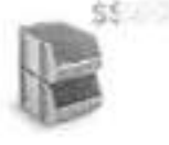
Caixa Plástica Número 5