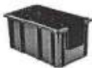
Caixa Plástica Gaveteiro 14 Litros

Caixas Plástica Padrão para Almojarifados, Autopeças e Estoques em Geral. Direto da Fábrica com entrega imediata. Solicite um orçamento na hora e confira os ótimos preços.