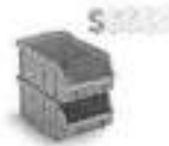
Caixa Plástica Número 4