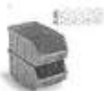
Caixa Plástica Número 3