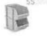
Caixa Plástica Número 6