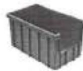
Caixa Plástica Gaveteiro 74 Litros