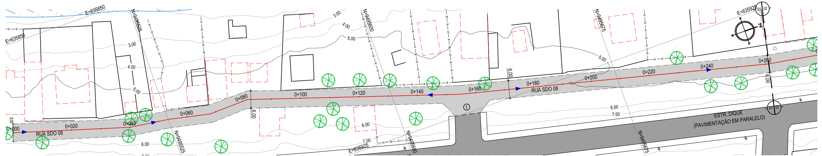
PLANTA BAIXA ESCALA: 1/750