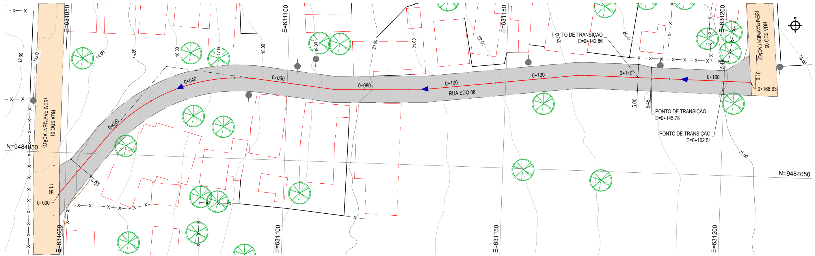
PLANTA BAIXA ESCALA: 1/500