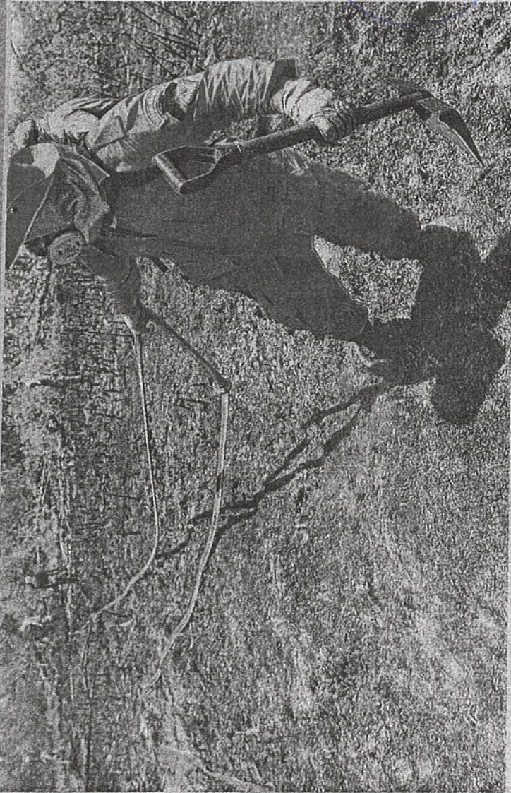
PARQUE DO COCÓ teve 46 hectares afetados pela ação no incêndio

ANA RUTE RAMIRES ruteramires@opovo.com.br