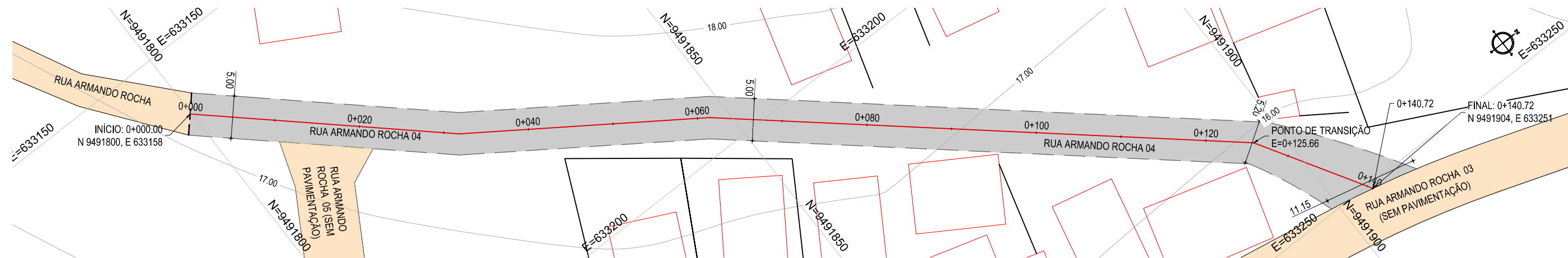
PLANTA BAIXA ESCALA: 1/500