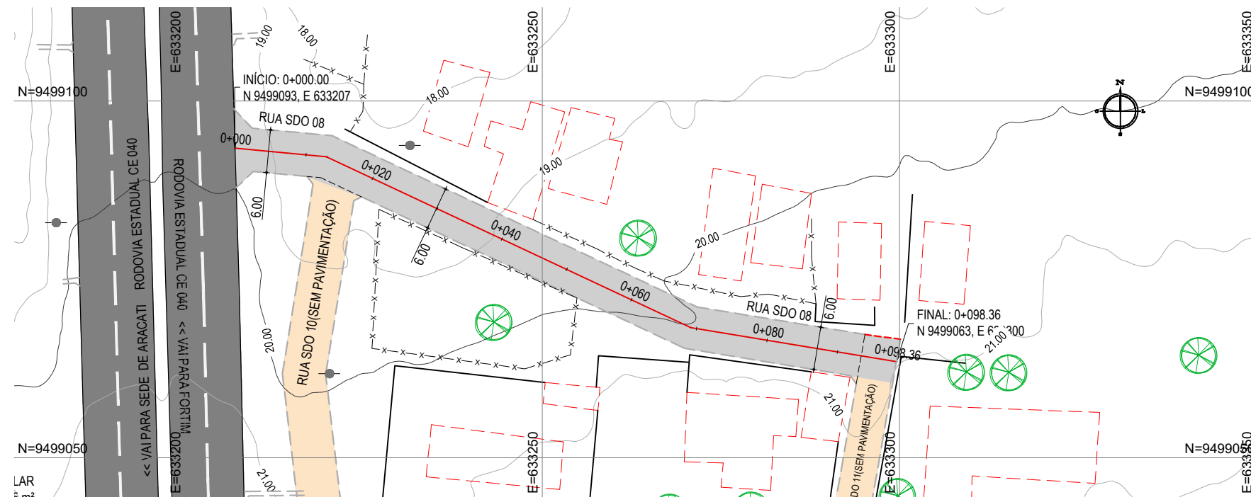
PLANTA BAIXA ESCALA: 1/750