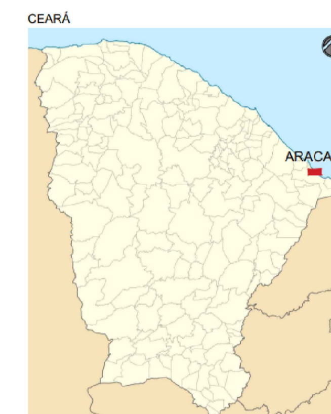
04 LOCALIZAÇÃO ARACATI