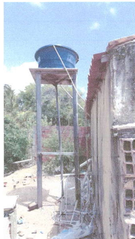
Fotografia 07 – Caixa D'água.