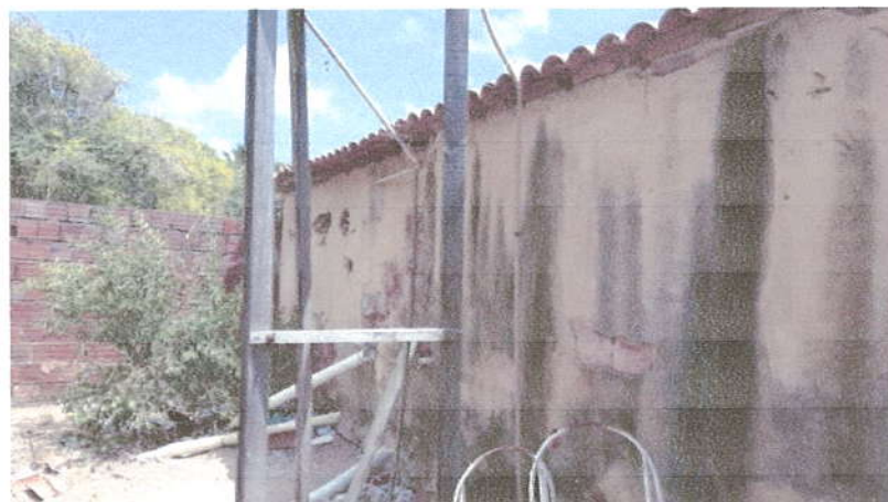
Fotografia 03 – Circulação Externa.