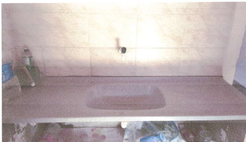
Fotografia 08 – Área de Serviço.