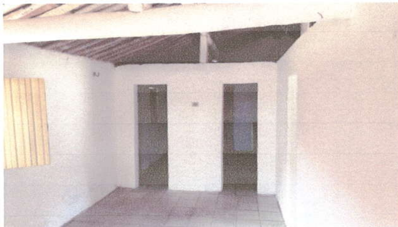
Fotografia 02 – Hall de Entrada.