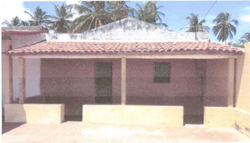
Fotografia 01 – Fachada do Imóvel.