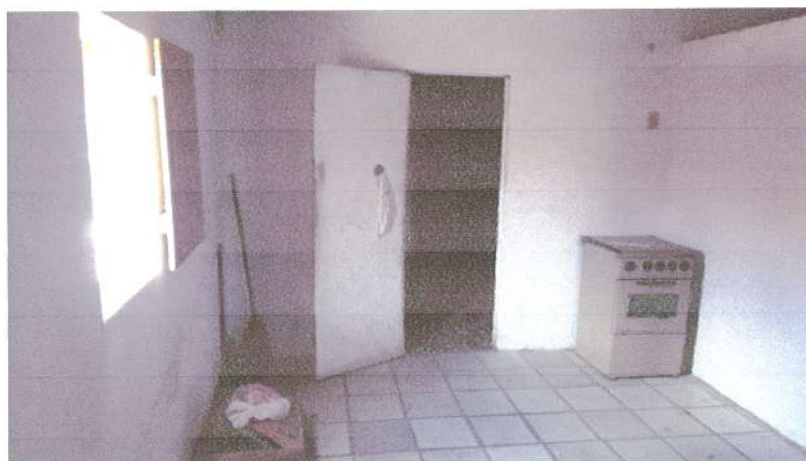
Fotografia 09 – Área de Serviço.