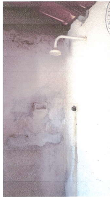
Fotografia 05 – Banheiro.