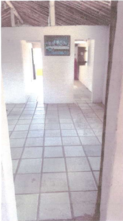
Fotografia 04 – Circulação Interna.