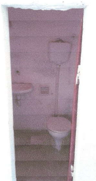
Fotografia 06 – Entrada Banheiro.