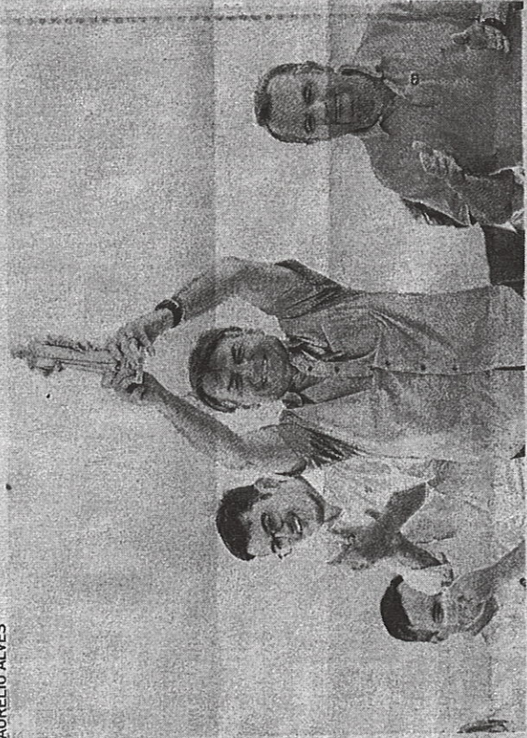
ESTA será a terceira visita de Bolsonaro ao Ceará em 2021

o estádio municipal. De lá, Bolsonaro se desloca até o local de realização do evento. Da bancada de deputados federais do Ceará, tem presença certa apenas Jaziel Pereira (PL). Dos estaduais, André Fernandes (Republicanos) e Delgado Cavalcante (MDB) mantin-