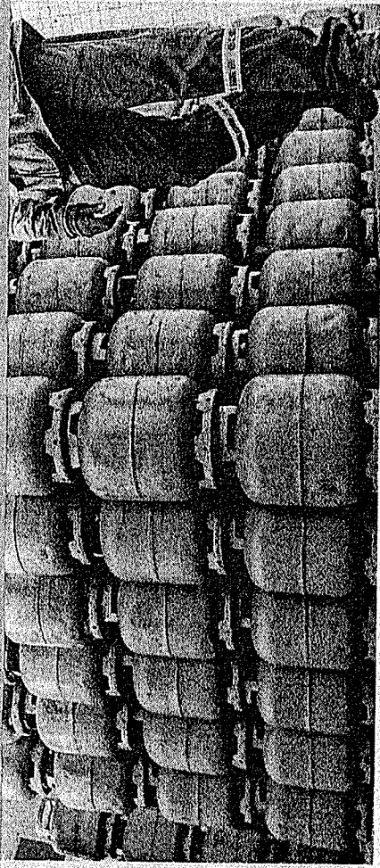
Preço máximo de R$ 115 persiste desde outubro no Ceará

Famílias inscritas no Cadastro Único, com renda familiar mensal per capita menor ou igual a meio salário-mínimo nacional, têm direito ao vale. Da mesma forma, que famílias que tenham, entre seus membros residentes no mesmo domicílio quem receba o benefício de prestação continuada da assistência social. Famílias com mulheres vítimas de violência doméstica que estejam sob medidas protetivas de urgência também podem recorrer ao auxílio.