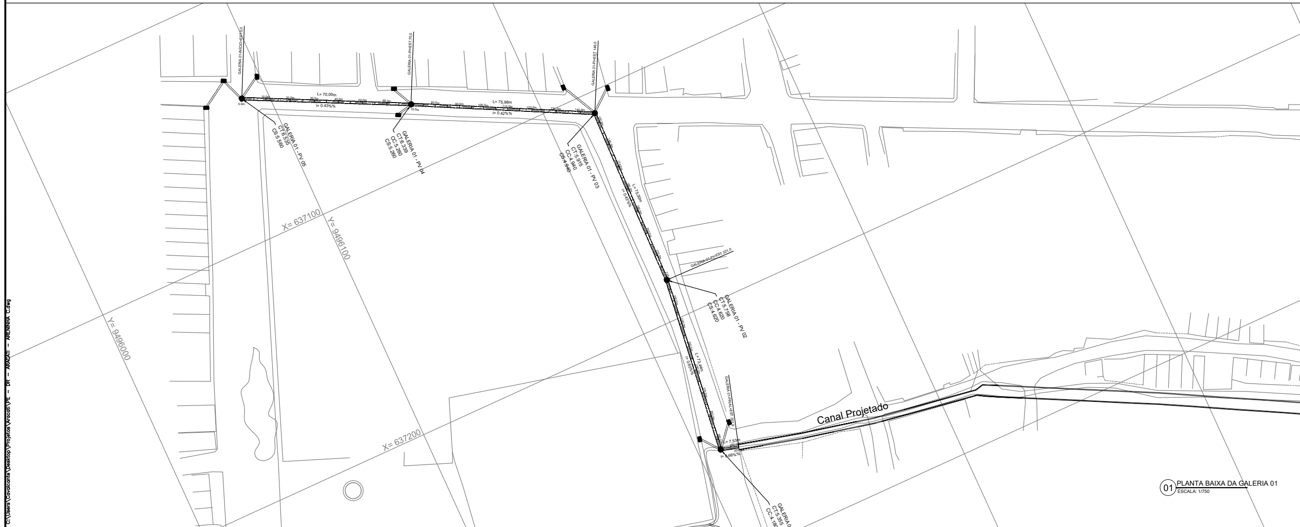
01 PLANTA BAIXA DA GALERIA 01 ESCALA: 1/750