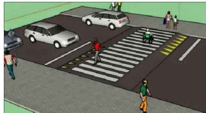
3 IMAGEM ILUSTRATIVA SEM ESCALA