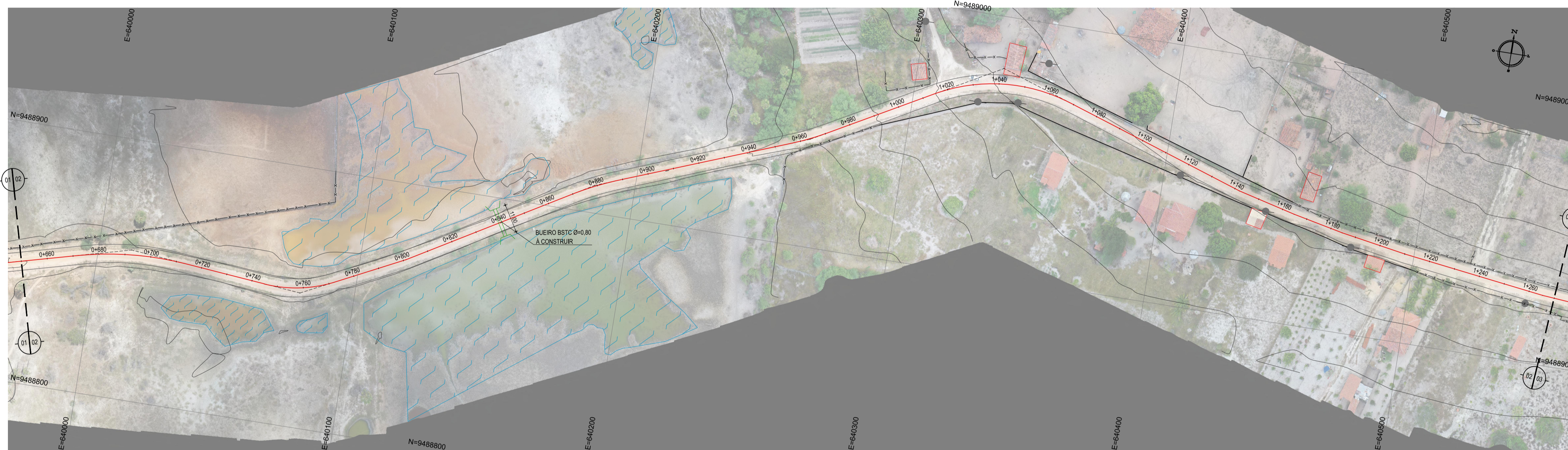
02 PLANTA BAIXA 02 ESCALA: 1/1000