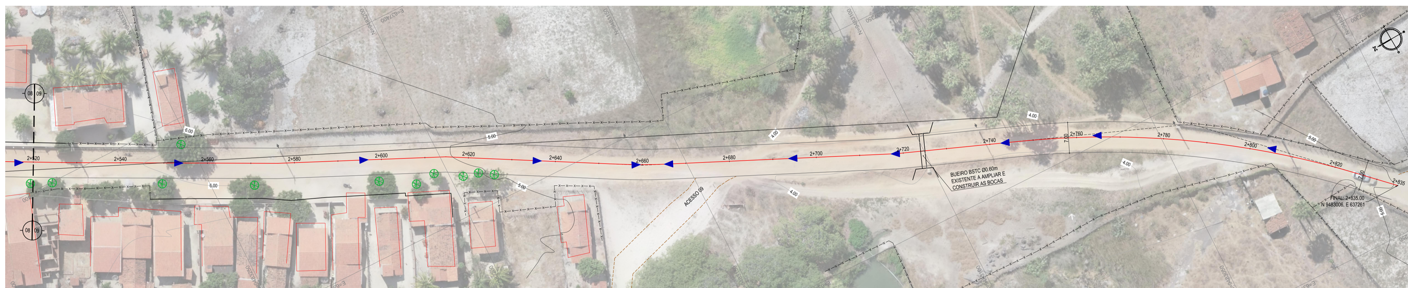
01 PLANTA BAIXA 09 ESCALA: 1:500