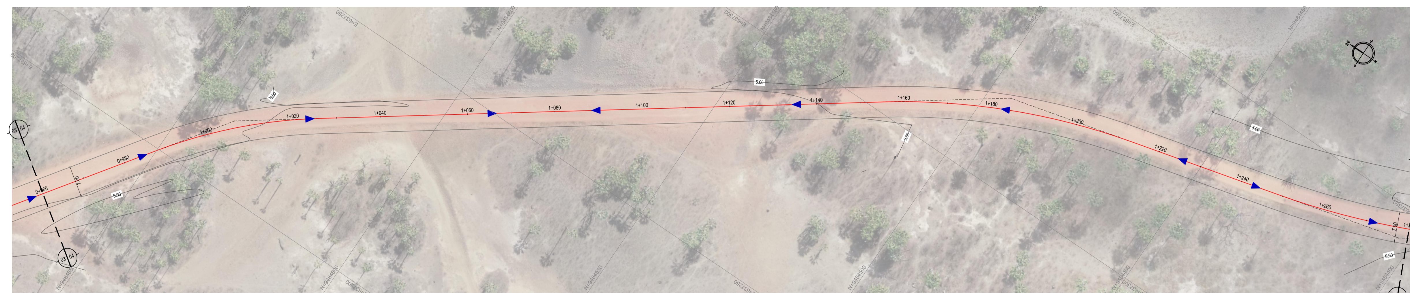
02 PLANTA BAIXA 04 ESCALA: 1:500