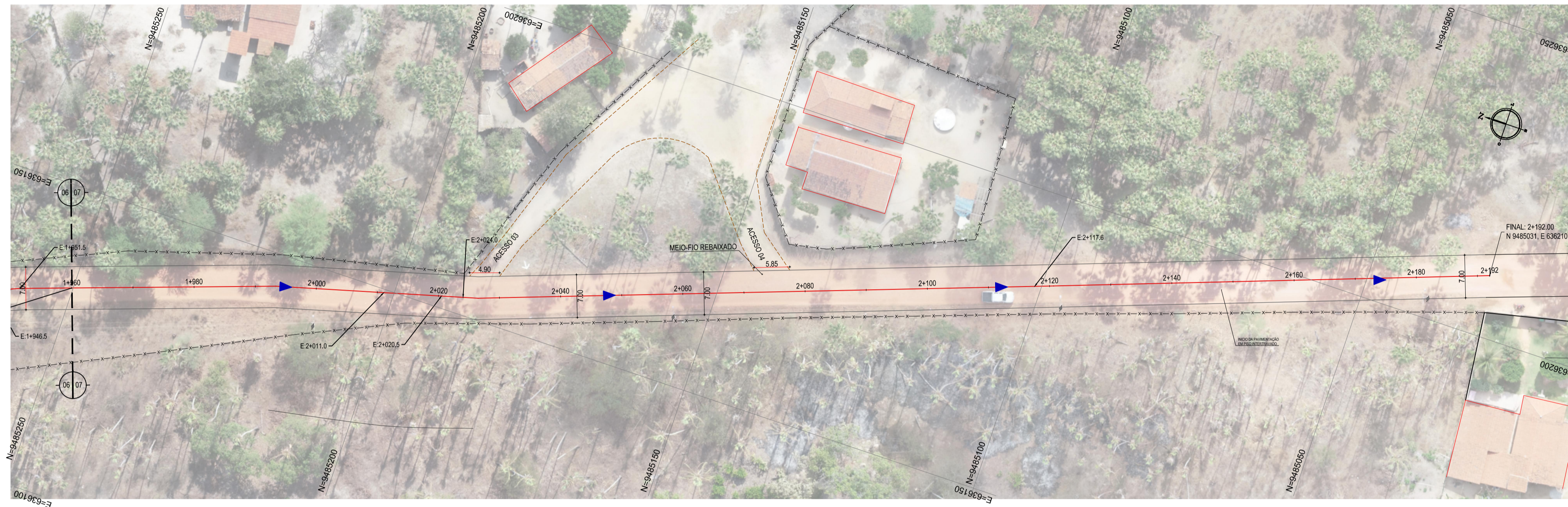
01 PLANTA BAIXA 07 ESCALA: 1:500