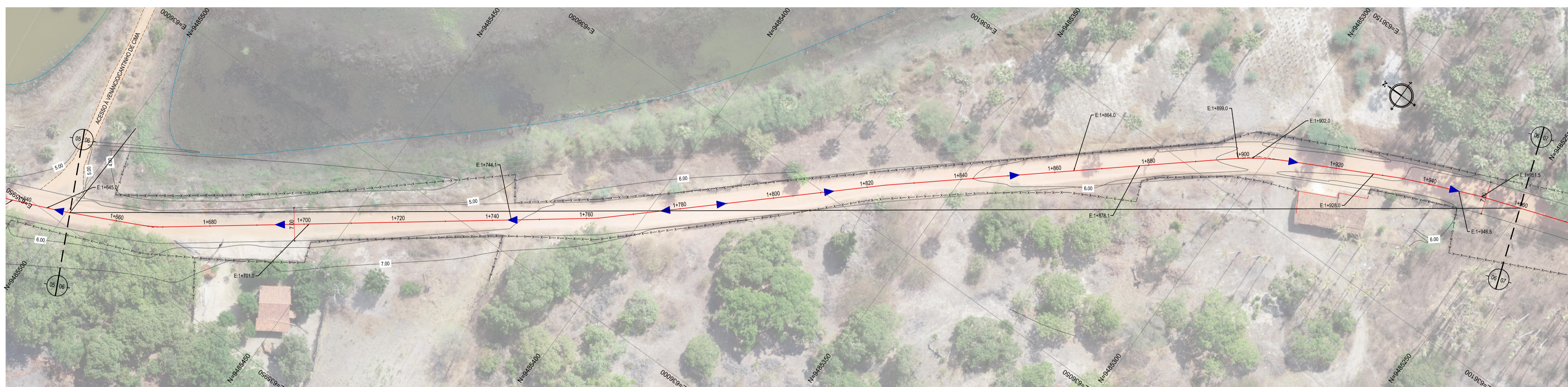
02 PLANTA BAIXA 06 ESCALA: 1:500