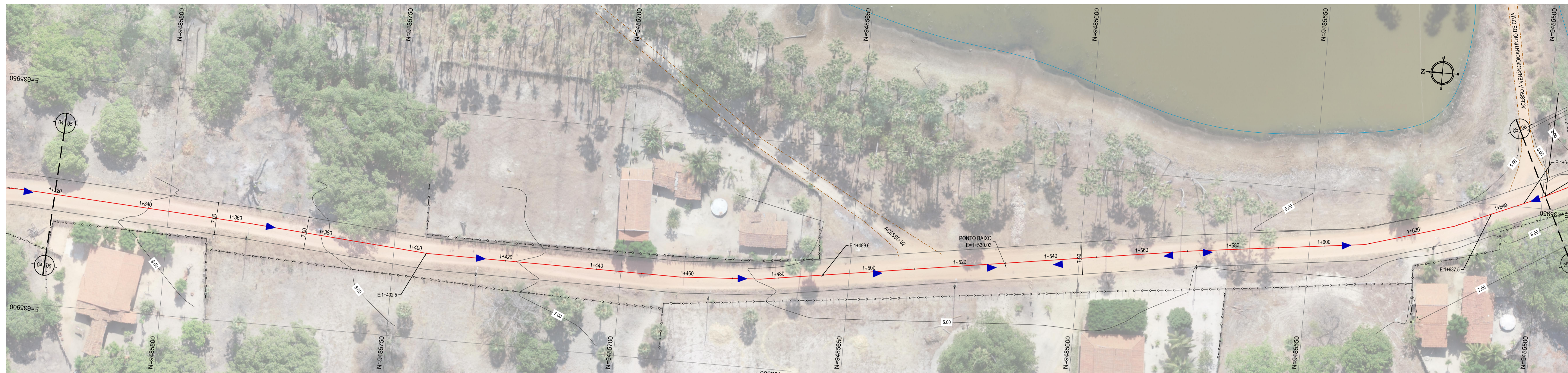
01 PLANTA BAIXA 05 ESCALA: 1:500