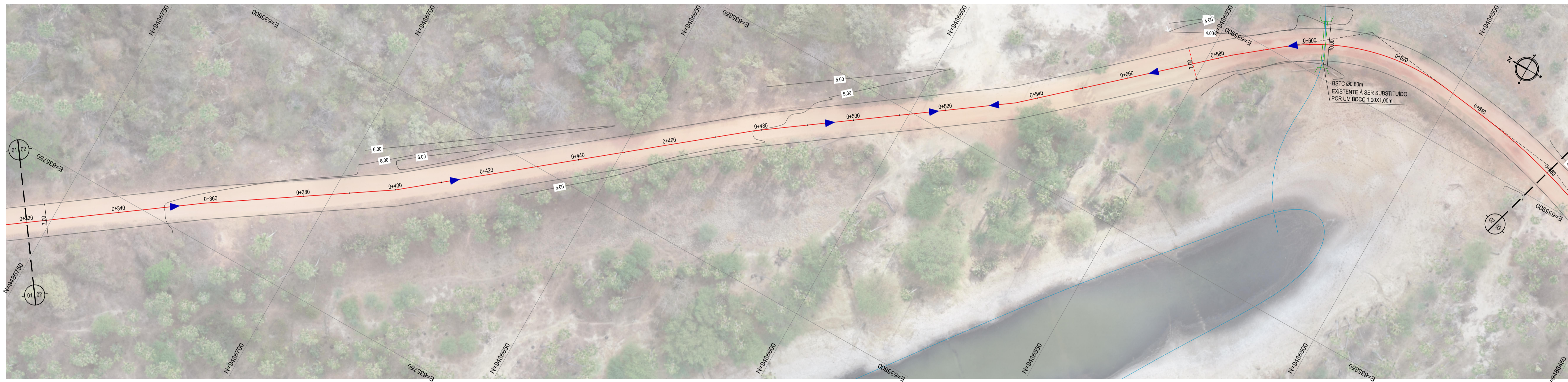
01 PLANTA BAIXA 01 ESCALA: 1:500

NOTAS DATUM VERTICAL - ARBITRADO SISTEMA DE COORDENADAS - SIRGAS (WGS84) MERIDIANO CENTRAL - 39° W GR. PROJEÇÃO UNIVERSAL DE MERCATOR (UTM) - ZONA 24M