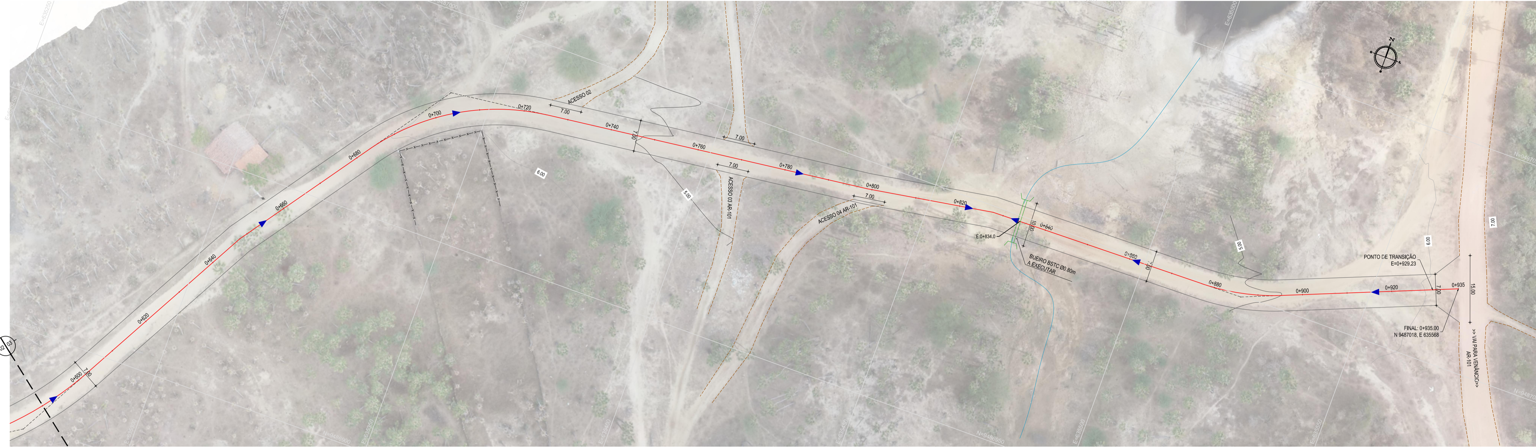
01 PLANTA BAIXA 03 ESCALA: 1:500