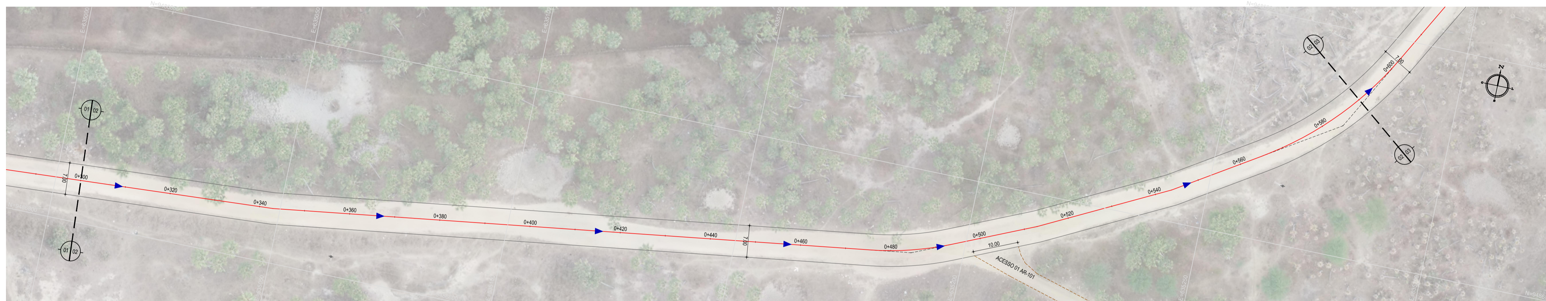
02 PLANTA BAIXA 02 ESCALA: 1/500