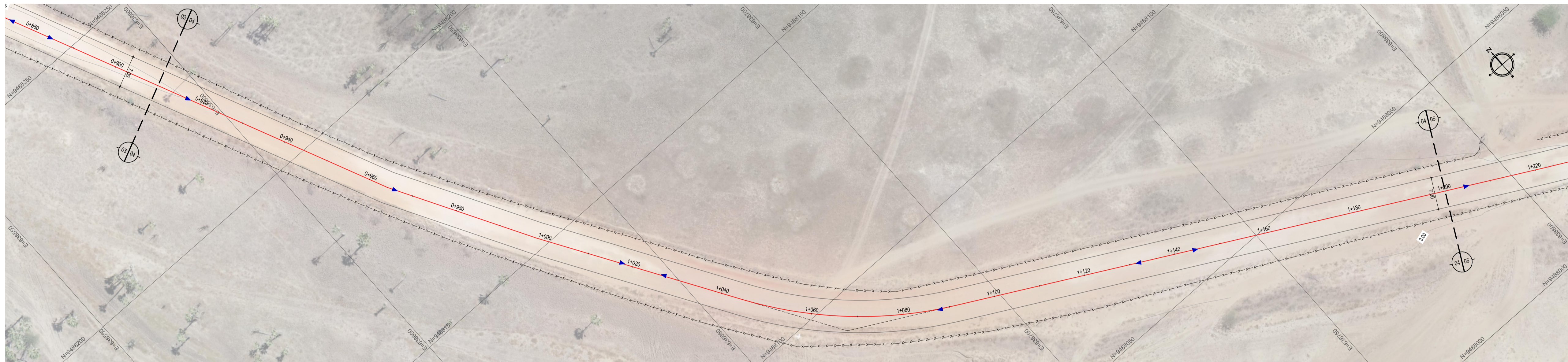
02 PLANTA BAIXA 04 ESCALA: 1:500