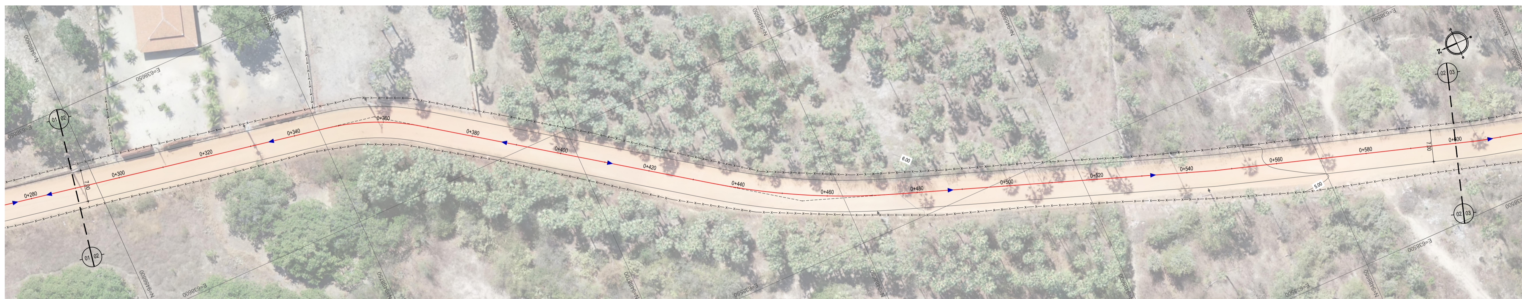
02 PLANTA BAIXA 02 ESCALA: 1:500