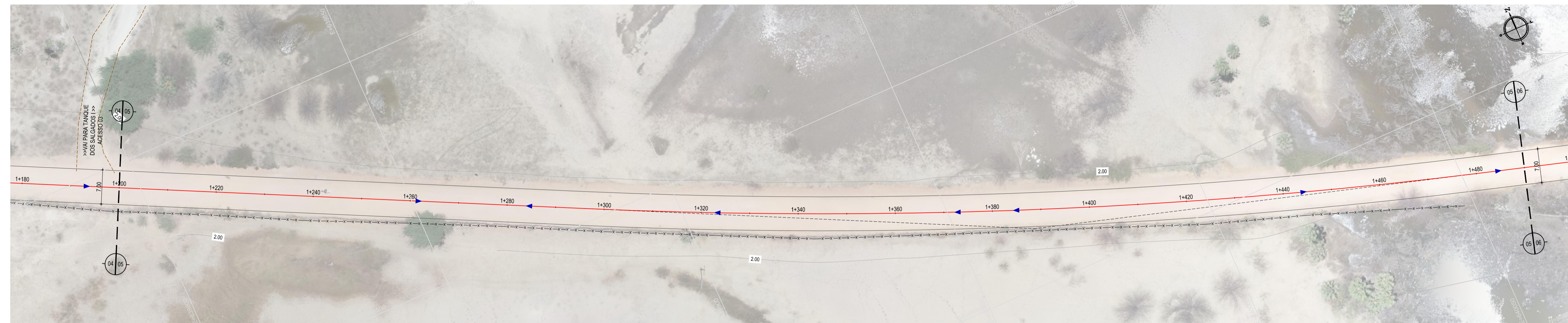
01 PLANTA BAIXA 05 ESCALA: 1/500