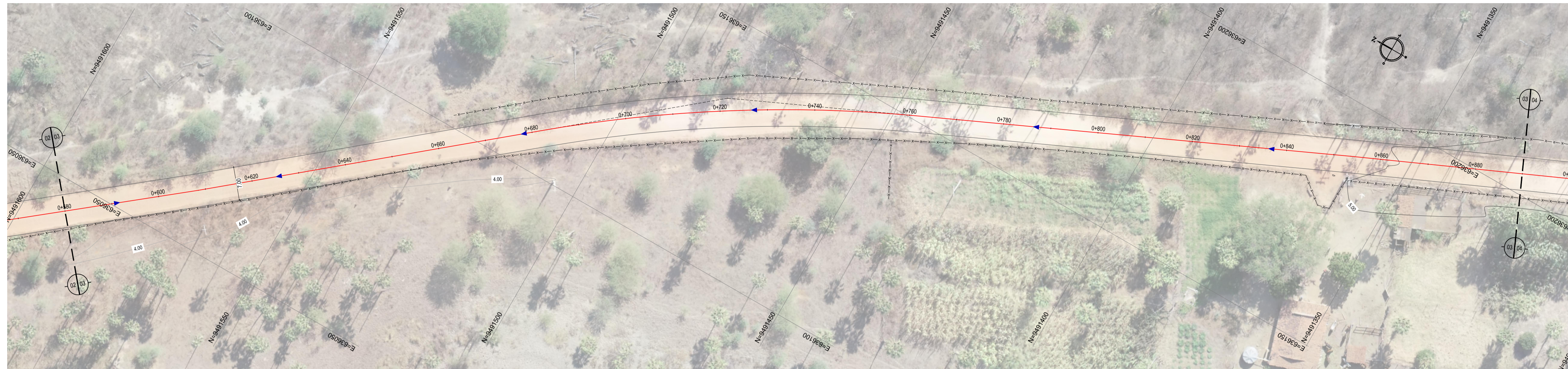
01 PLANTA BAIXA 03 ESCALA: 1:500