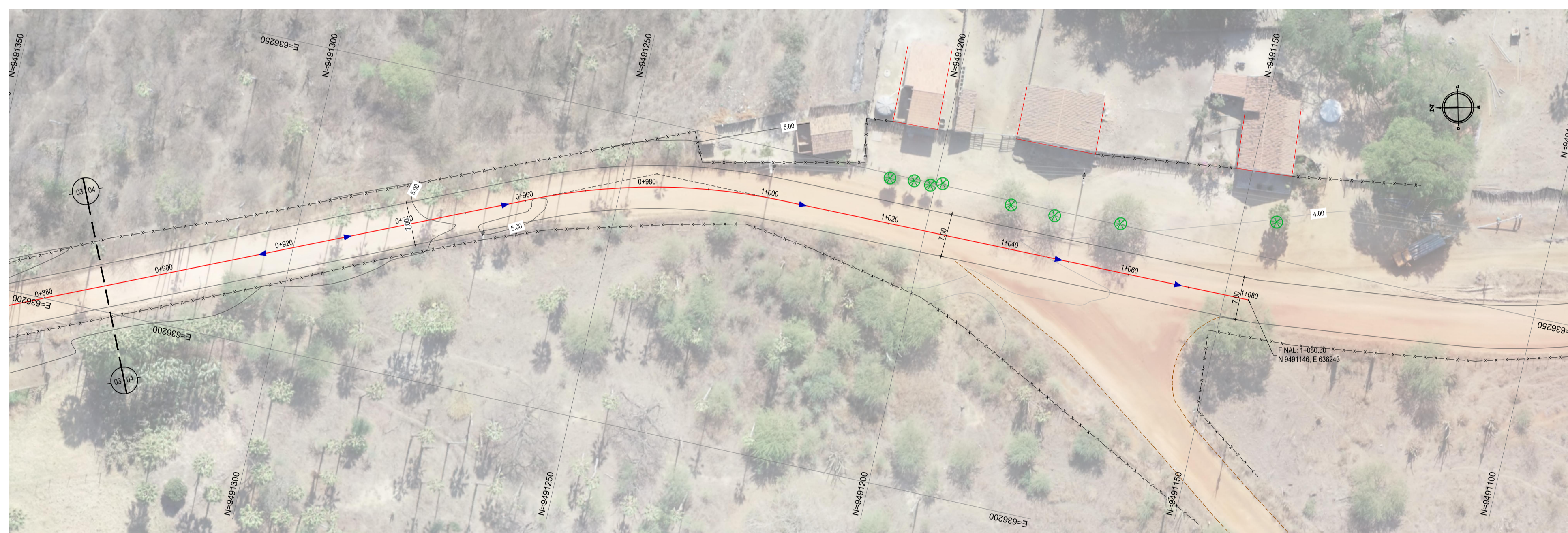
02 PLANTA BAIXA 04 ESCALA: 1:500