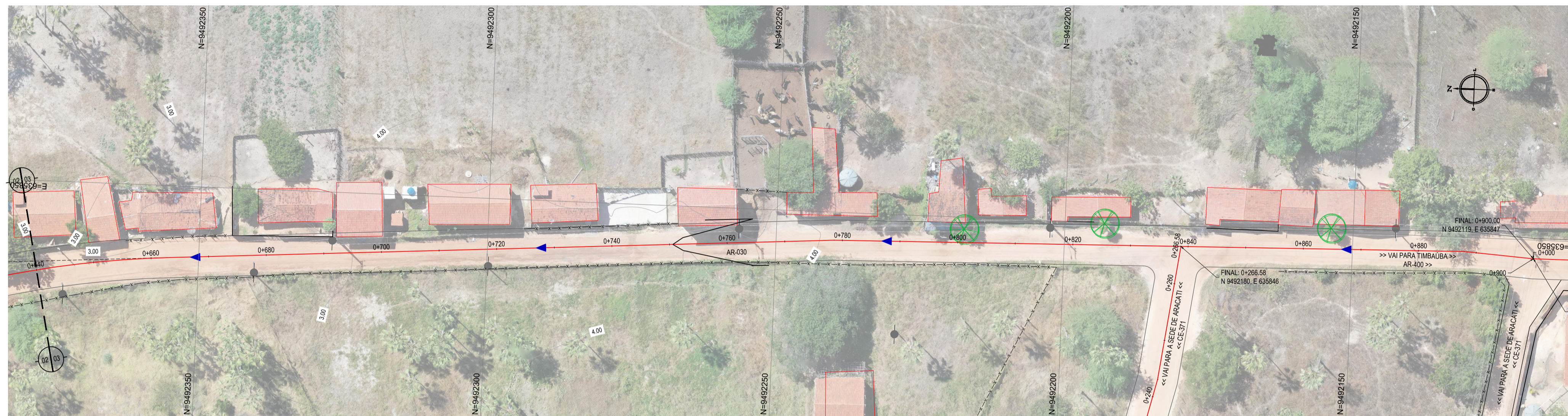
02 PLANTA BAIXA 03 ESCALA: 1/500