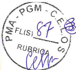
Tabela de Custos - Versão 024.1

C0631 - CAIXA EM ALVENARIA (40X40X60cm) DE 1/2 TIJOLO COMUM, LASTRO DE BRITA E TAMPA DE CONCRETO