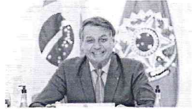
PRESIDENTE brasileiro rebateu declaração do candidato democrata

Em reação à fala do candidato norte-americano Joe Biden sobre a Amazônia, o presidente Jair Bolsonaro (sem partido) afirmou que a declaração foi "gratuita e desastrosa". Nas redes sociais, Bolsonaro, em português e inglês, disse que a soberania brasileira é "inegociável" e avaliou que a declaração sinaliza "claramente abrir mão de uma convivência cordial e profícua" entre os países.